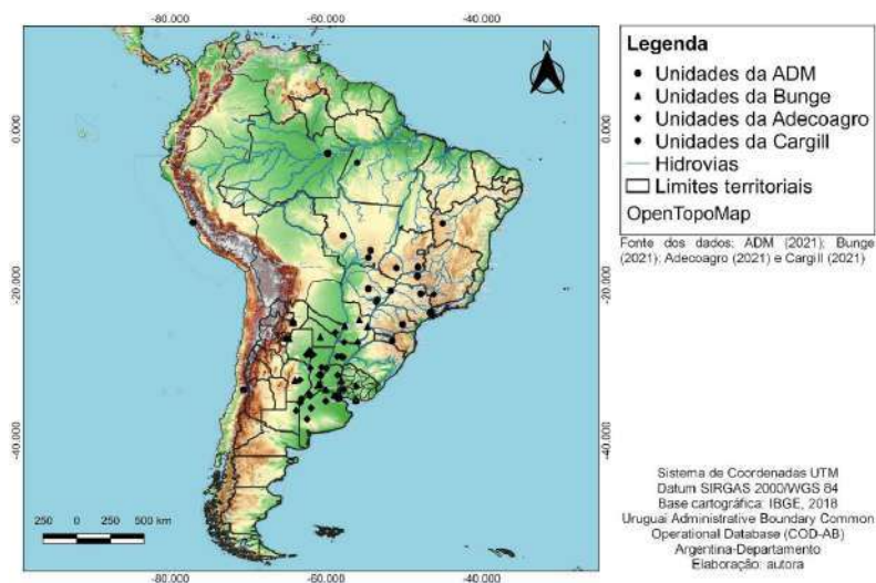
Figura 1. Distribuição geográfica das tradings que controlam a cadeia produtiva da soja na América do Sul