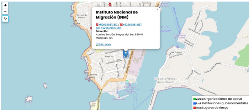
Figura 3. Globos Azules: Instituciones de Gobierno Migratorias

En la cartografía se indican las asociaciones o albergues de apoyo para migrantes disidentes sexuales mediante globos verdes. Al seleccionar un globo se despliegan los datos de contacto de la asociación o albergue, una descripción breve de los apoyos que se brindan y las condicionantes para recibirlos. En los datos de contacto se puede seleccionar el número de teléfono o el icono de la red social para conectarse directamente (ver figura 2). Las instituciones de gobierno para hacer trámites migratorios aparecen como globos azules y también se despliegan los datos de contacto (ver figura 3).