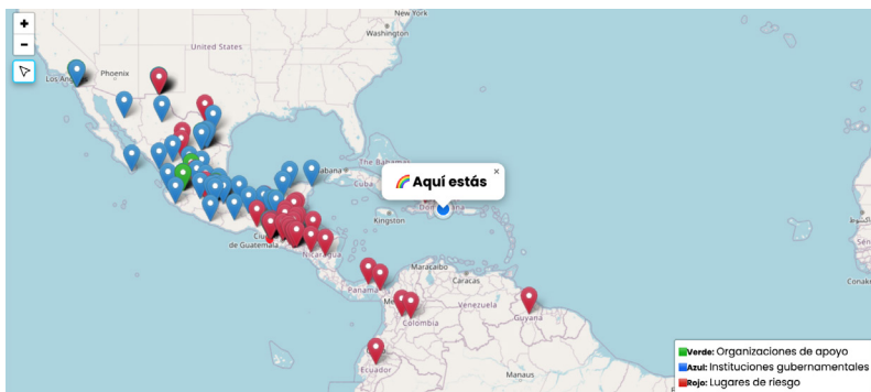
Figura 1. Cartografía Digital para el Autocuidado entre Migrantes LGBT+

Toda la información recabada se utilizó para realizar la cartografía digital para el autocuidado entre migrantes LGBT+ . La cartografía digital es una página de internet (.com) con un mapa anclado al sistema de geoposicionamiento global, que identifica el lugar donde se encuentra la persona que accede a este sitio. En la cartografía se muestran los lugares de apoyo para migrantes LGBT+, las oficinas para realizar trámites migratorios y los puntos de peligro en el tránsito, particularmente de Centroamérica y México (ver figura 1).