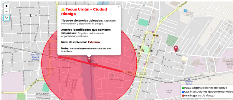
Figura 4. Globos Rojos: Zonas de Mayor Riesgo