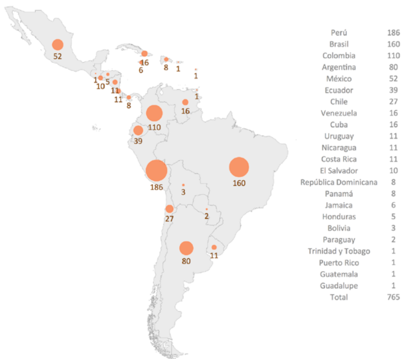
Figura 2. Repositorios de América Latina por país. Datos de OpenDOAR

Por otro lado, el Acceso Abierto diamante es el modelo prevalente dentro de las revistas científicas. Así lo muestra DOAJ, 12.669 revistas no cobran APC (DOAJ, 2022), lo que representa el 70% de las revistas que indexa. Este término paradójicamente acuñado fuera de América Latina, cuenta con la tradición de publicación latinoamericana como su más significativo exponente. La encuesta realizada en 2021 para documentar la infraestructura que sostiene la publicación científica latinoamericana, encontró que únicamente el 4,2% de las revistas cobran a los autores (Becerril-García, 2021, p. 133).