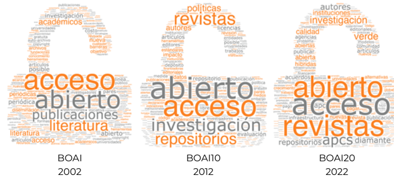
Figura 1. La evolución en el discurso de la Budapest Open Access Initiative